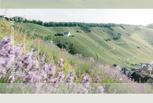
Urzig©R1 Faszination Mosel